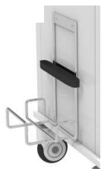
ゴミ箱ホルダー付き